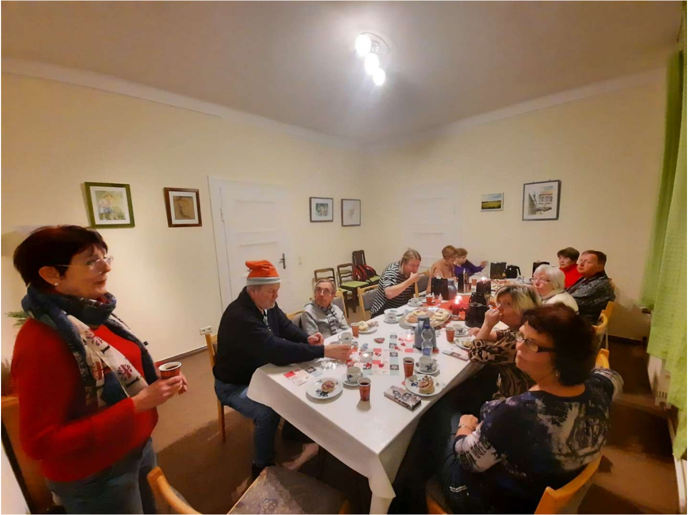
Gemeindenachmittag 11.12.24 / 15.01.25