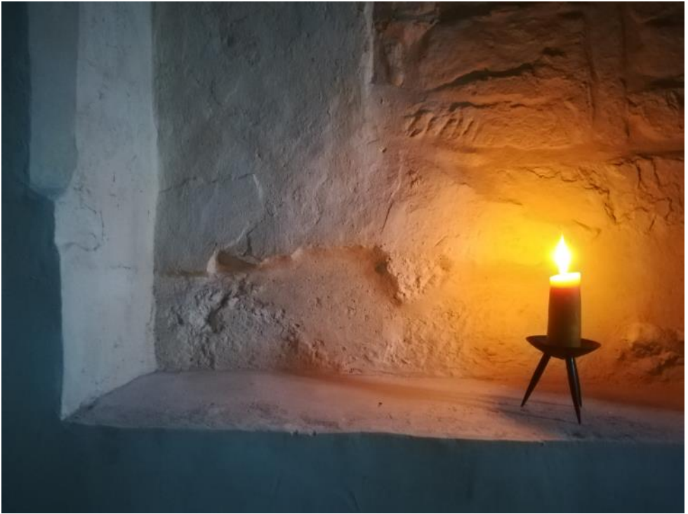
Kerze in der Sakristei im Dom